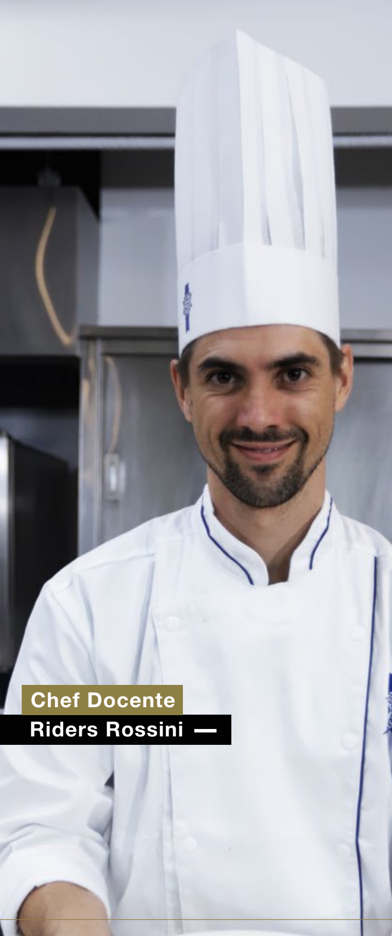
Chef Docente Riders Rossini —